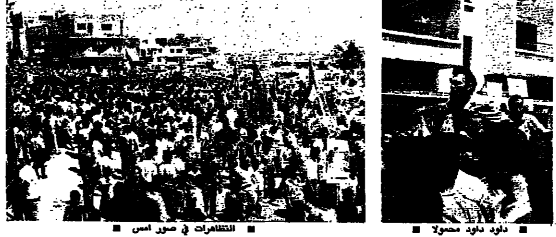
تظاهرات في صور امس